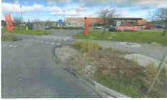
Rond Point Carrefour Market