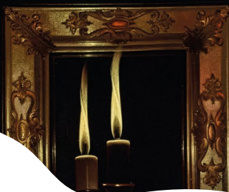
© La Madeleine aux deux flammes 1640