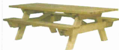
TABLE PIQUE-NIQUE CANADA Version à sceller ou à poser Pin traité autoclave classe IV certifié FSC Dimensions : L 2000 ou 2300 x l 1600 x H 750 mm Lames assise et plateau ép. 45 mm Largeur du plateau : 890 mm Assises L 2000 mm Livrée pré-montée Modèle à sceller anti-vandalisme : renfort métallique à l'intérieur des pieds rendant le sciage impossible Poids simple à sceller : 109 kg Poids rallongée à sceller : 119 kg Poids simple à poser : 107 kg Poids rallongée à poser : 117 kg Traitement garanti 10 ans

- 4 équipements sportifs / soit un total de 2918 € ht