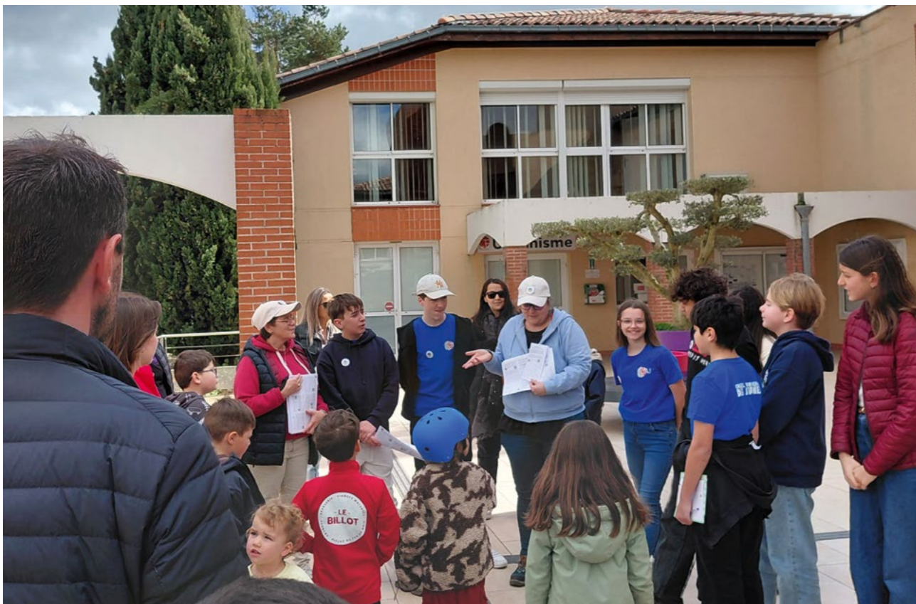
Inauguration en présence du CMJ, le 7 mars 2026