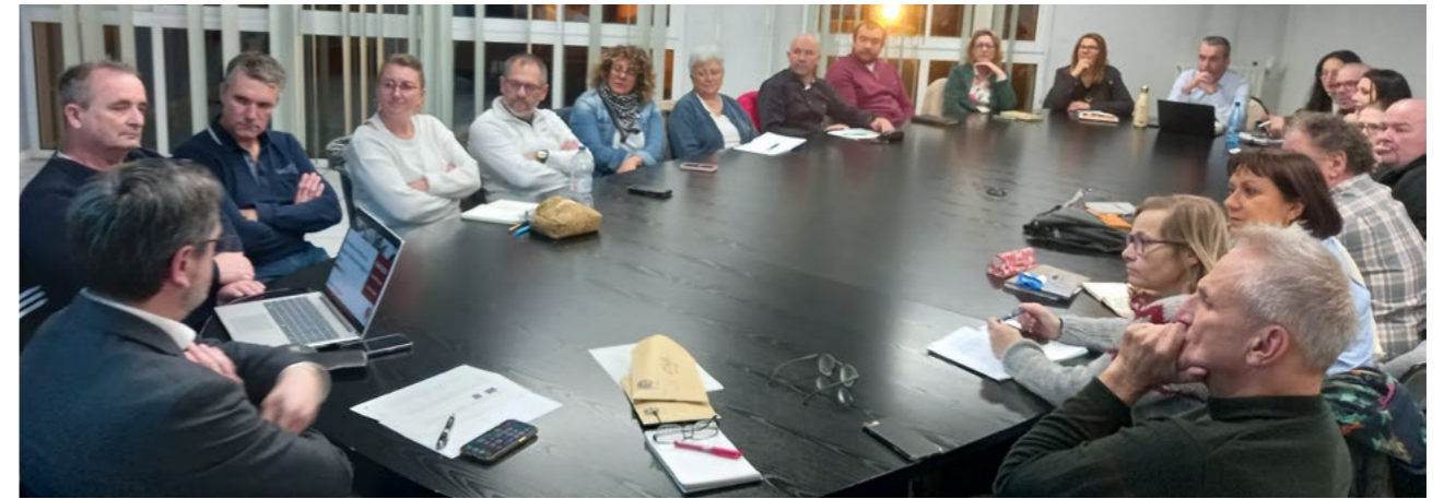
La nouvelle majorité municipale en réunion de travail autour du Maire

Magazine d'information de la Ville de Frouzins Directeur de la publication : Jérôme Laffon Comité de rédaction : Service communication communication@mairie-frouzins.fr Impression : Imprimerie Ménard Création graphique - Maquette : Terres du Sud Régie publicitaire : Éditions Bucerep - 05.61.21.15.72 Distribution : Saudrune diffusion Ce magazine est imprimé aux normes imprim'Vert sur papier PEFC, procédé CTP avec encres végétales.